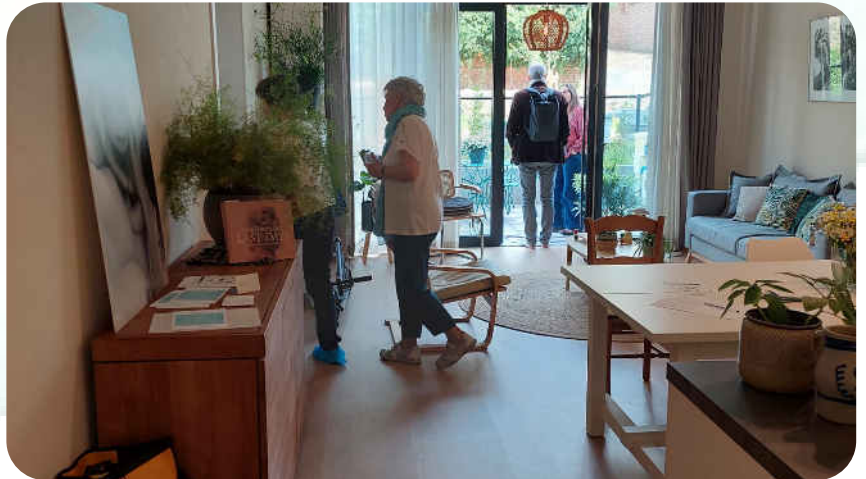
Salon de la maison de mourance, ouvert sur le jardin - 2022

A Pass-ages, une résidente de la maison de mourance est un·e hôte. Il·elle sera accueilli·e et accompagné·e comme tel·le, ainsi que ses aidant·es-proches.