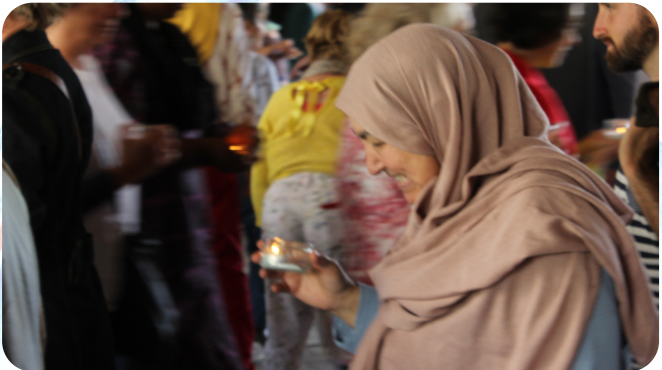
Lors de l'inauguration de Pass-ages - 8 mai 2022

Une discussion préalable permet de déterminer le montant de la participation.