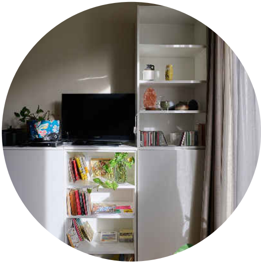
Salon - meuble TV et bibliothèque