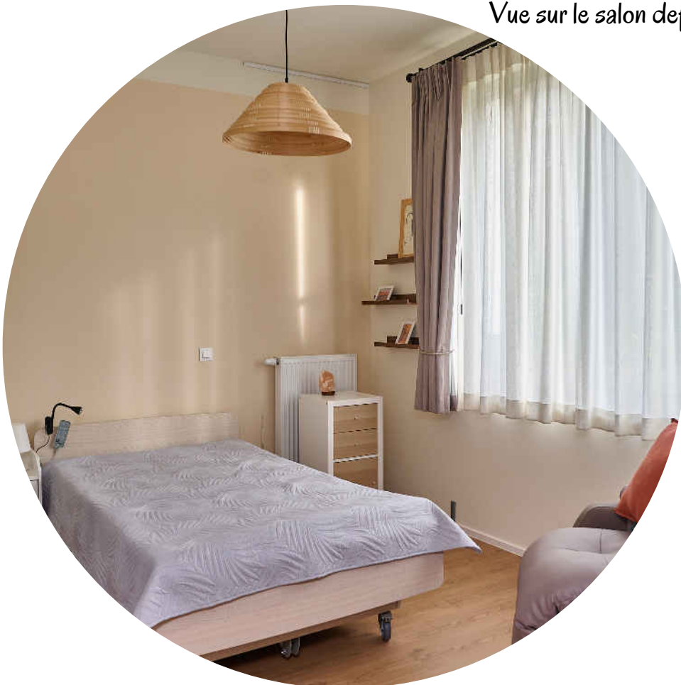
Chambre avec lit confort médical