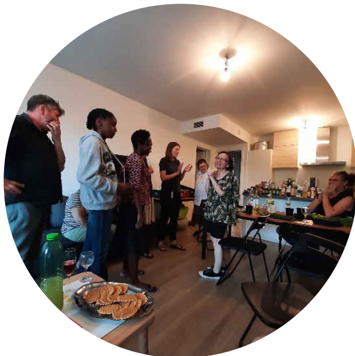
Fête d'anniversaire d'une hôte - 2022