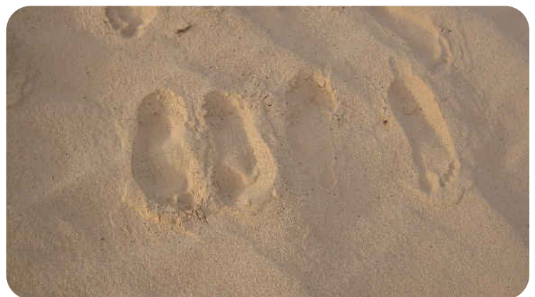
Evocation de trace de passages et de rituels

L'accompagnement de Passages s'entend comme une présence auprès de l'hôte et son entourage jusqu'après le décès. Pass-ages sera disponible pour les familles qui le souhaitent pour aider à l'élaboration d'une cérémonie d'adieu.