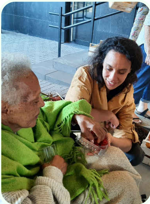
Une hôte en visite au marché avec une volontaire

En maison de mourance, l'accueil et l'accompagnement sont centrés sur les rythmes, besoins et singularités de la personne en fin de vie et de son entourage.