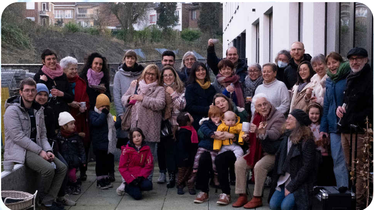
L'équipe des volontaires lors du souper de retrouvailles en janvier 2022

L'habitat groupé intergénérationnel propose aux personnes et familles habitantes, toutes porteuses du projet, de créer un modèle de vie centré sur le soin aux autres.