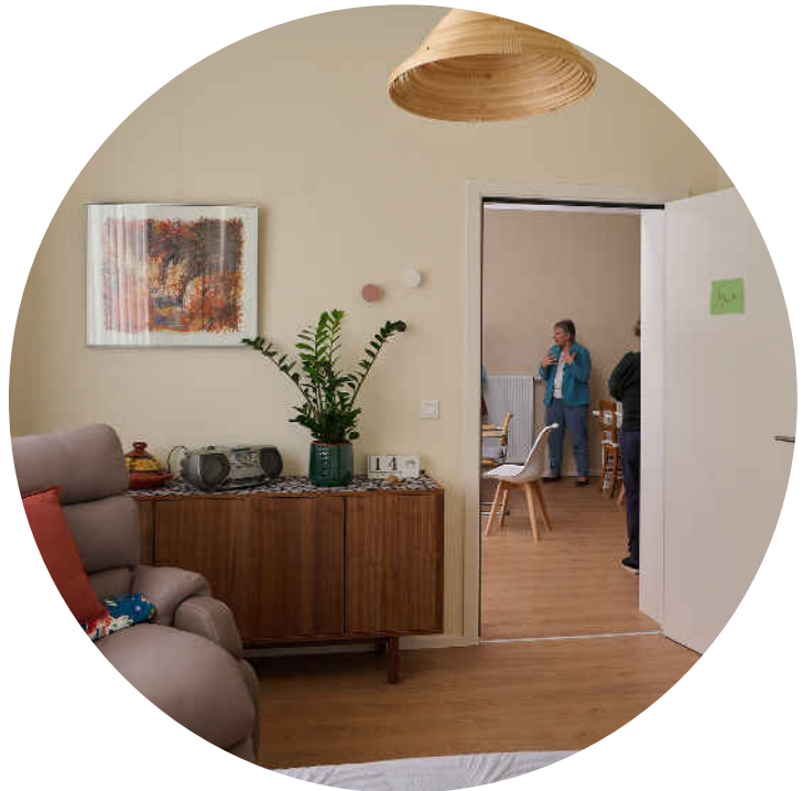
Vue sur le salon depuis la chambre