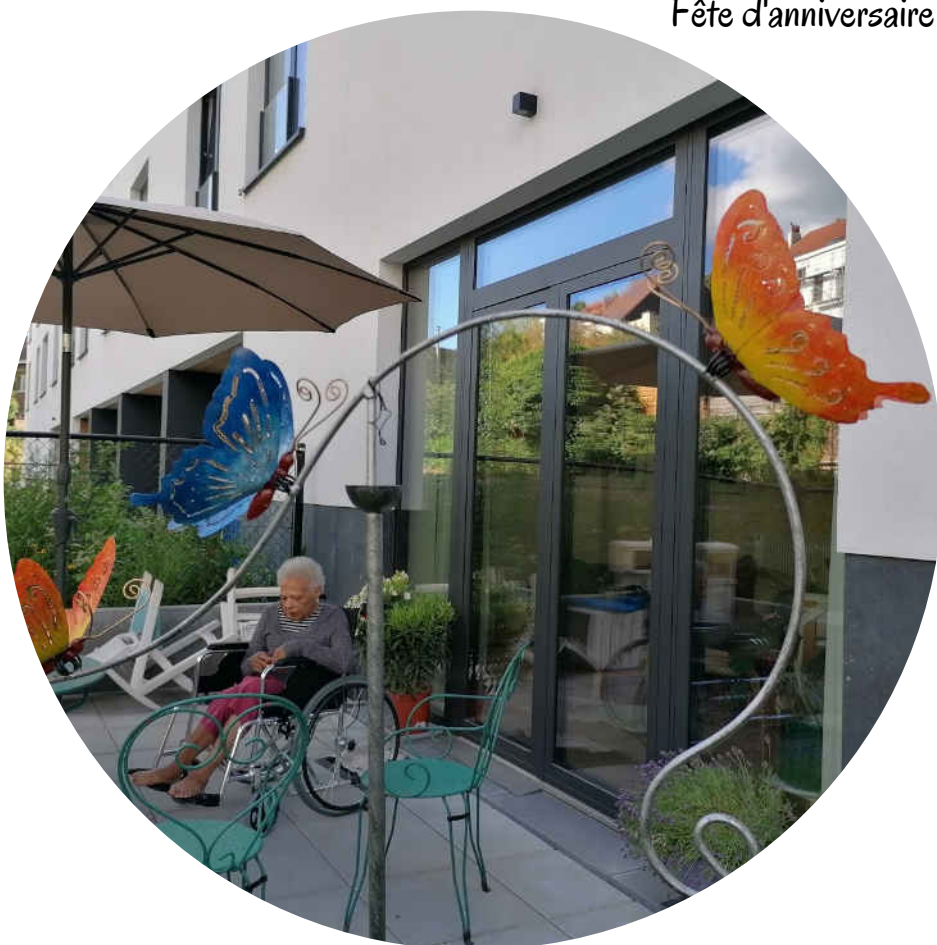
Une après-midi de printemps au jardin - 2022