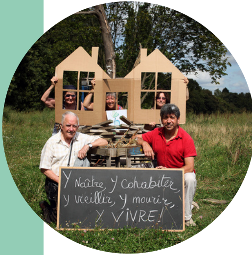
2016 - in projectontwikkeling