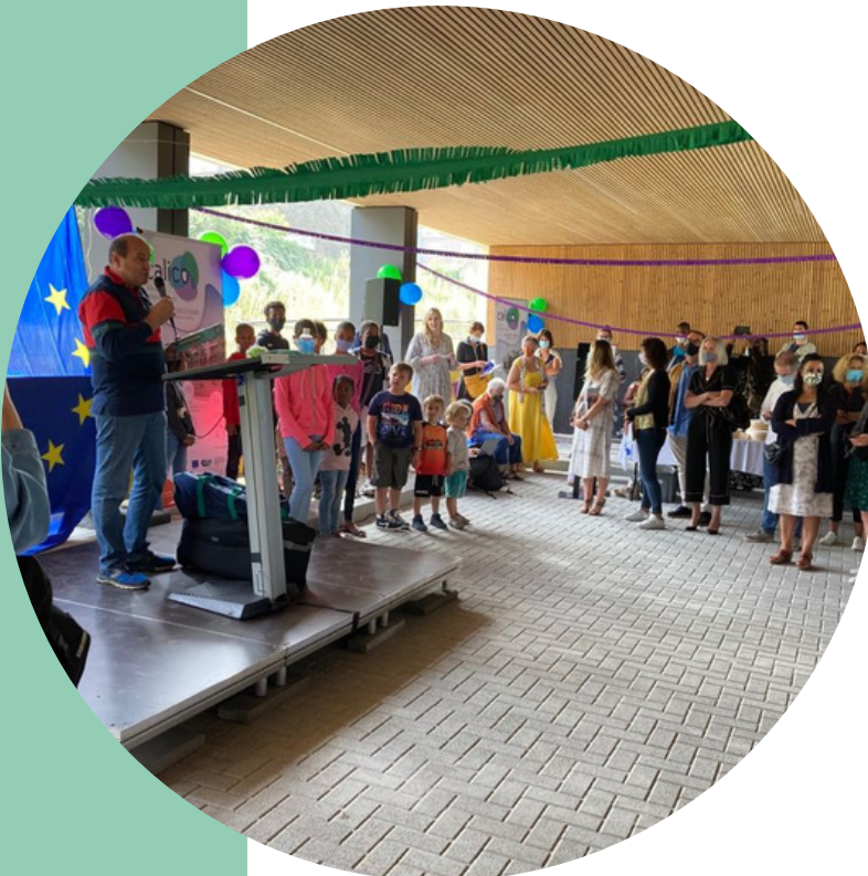
4 september 2021 - inauguratie van CALICO