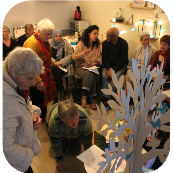
Rite d'accueil et de départ - janvier 2023

Le sens de l'action de Pass-ages s'est donné à voir concrètement en 2022. La plus-value humaine est forte et les témoignages reçus confortent Pass-ages dans son intuition que sa mission répond à un véritable besoin.