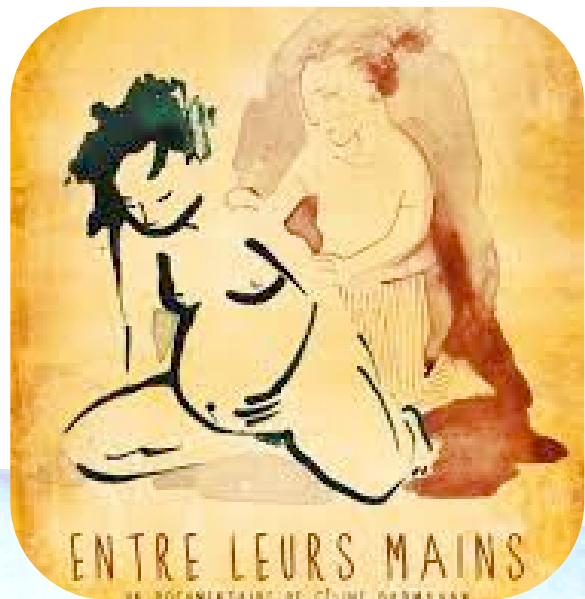
Affiche de film sur la naissance

En 2022, les sages-femmes ont accompagné les premières grossesses et les premiers accouchements, avec la présence discrète des volontaires veilleuses de Pass-ages.