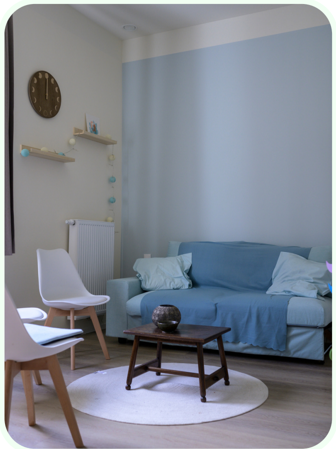
Espace de consultation - 2022