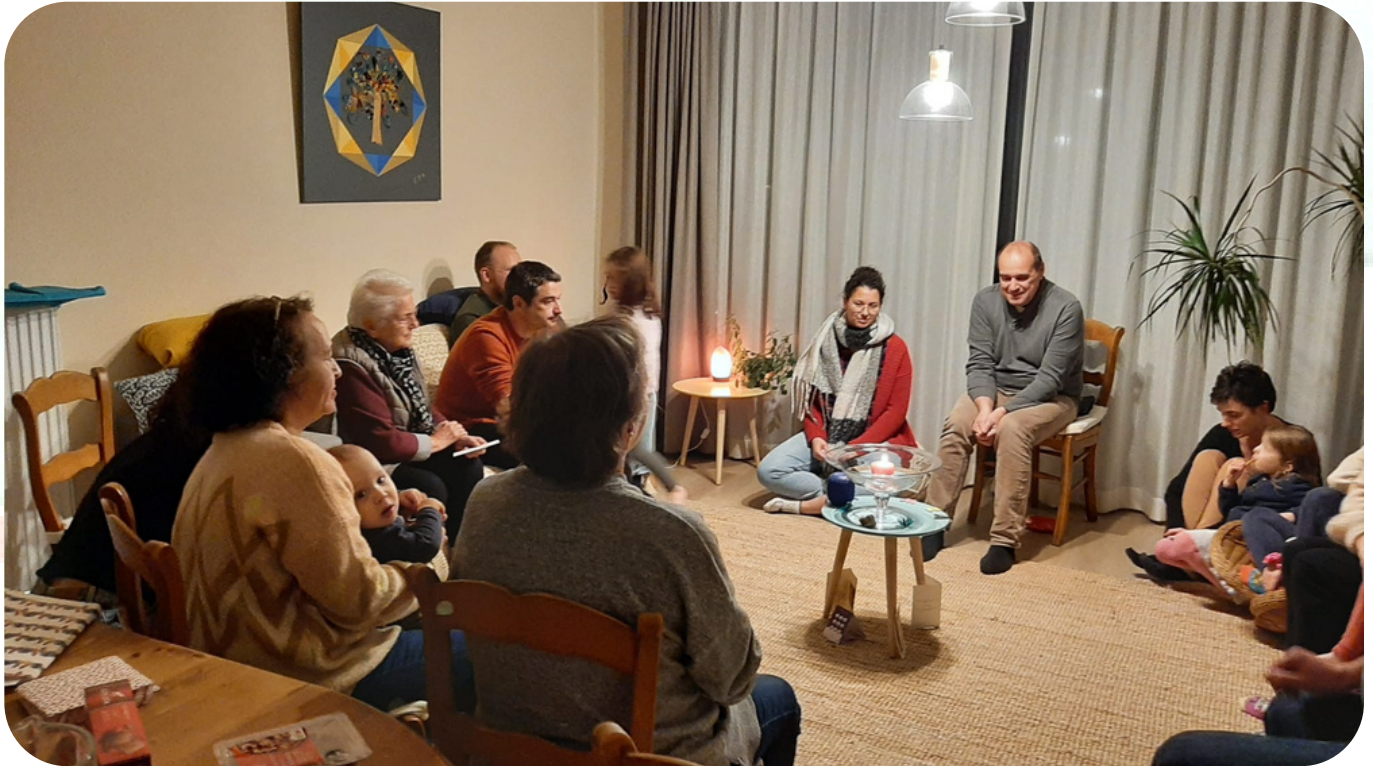
Soirée d'accueil d'un nouveau-né - 2022