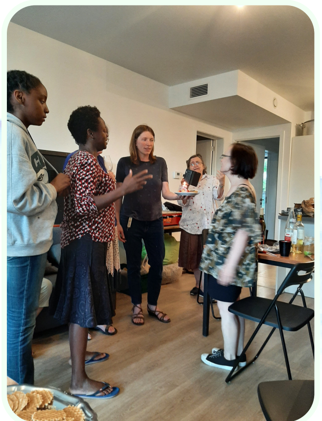
Anniversaire d'une hôte - 2022