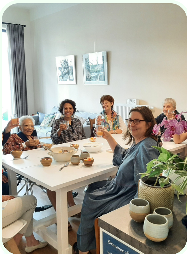
Accueil d'une hôte - 2022

A Pass-ages, les résidents de la maison de mourance sont nos hôtes. Ils sont accompagnés par nos volontaires dans un esprit d'entraide pour les besoins quotidiens et soignés par leur personnel soignant comme à domicile.