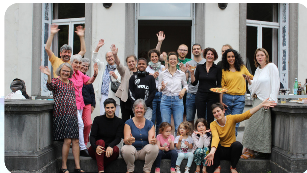
Fête de Pass-ages - juin 2021

L'habitat groupé intergénérationnel propose aux personnes et familles habitantes, toutes porteuses du projet, de créer un modèle de vie centré sur le soin aux autres.