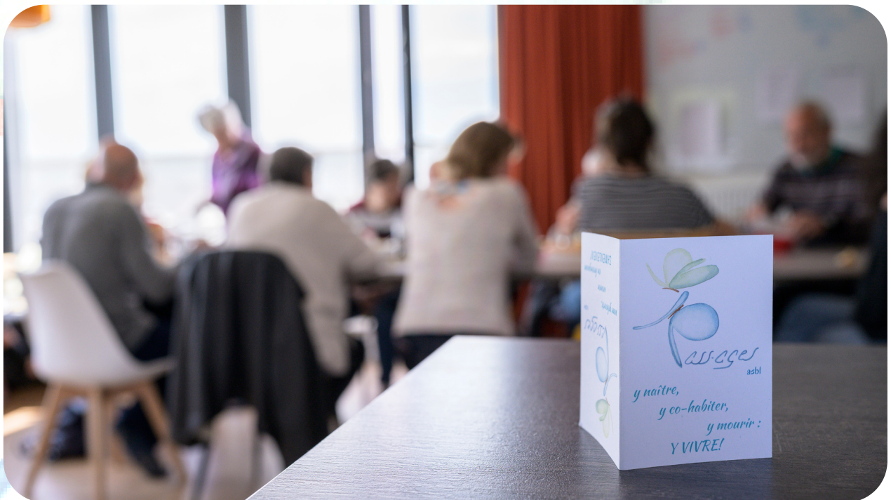
Formation à l'écoute - 2022

Le défi principal pour Pass-ages en 2023 est d'augmenter les accueils d'hôtes en naissance et en mourance et, pour ce faire, de créer la notoriété et consolider son modèle économique.