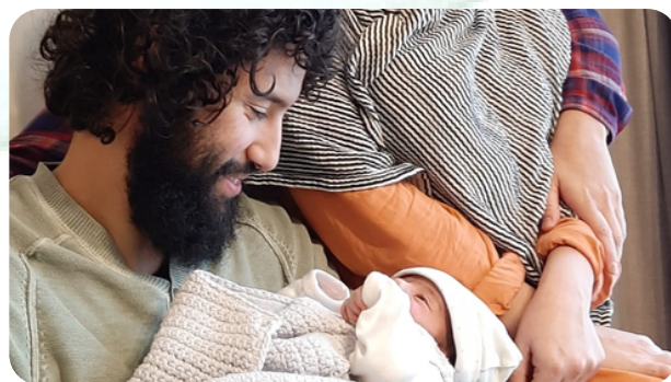
Naissance - 2022

La maison de naissance, ouverte à toutes et à tous, offre un suivi global à la naissance. Elle accompagne les parents depuis le désir d'enfant jusqu'à son premier anniversaire, y compris l'accouchement.