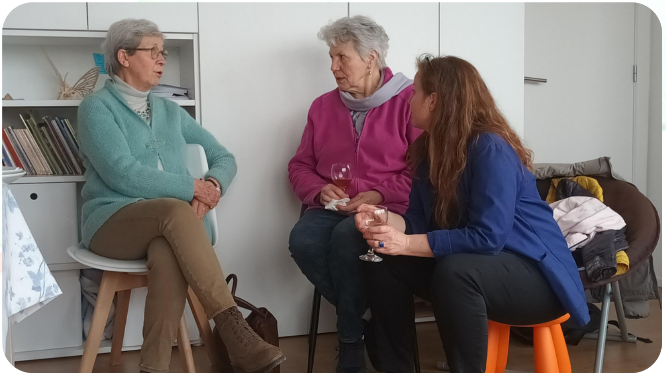
Fête des employés- 2023