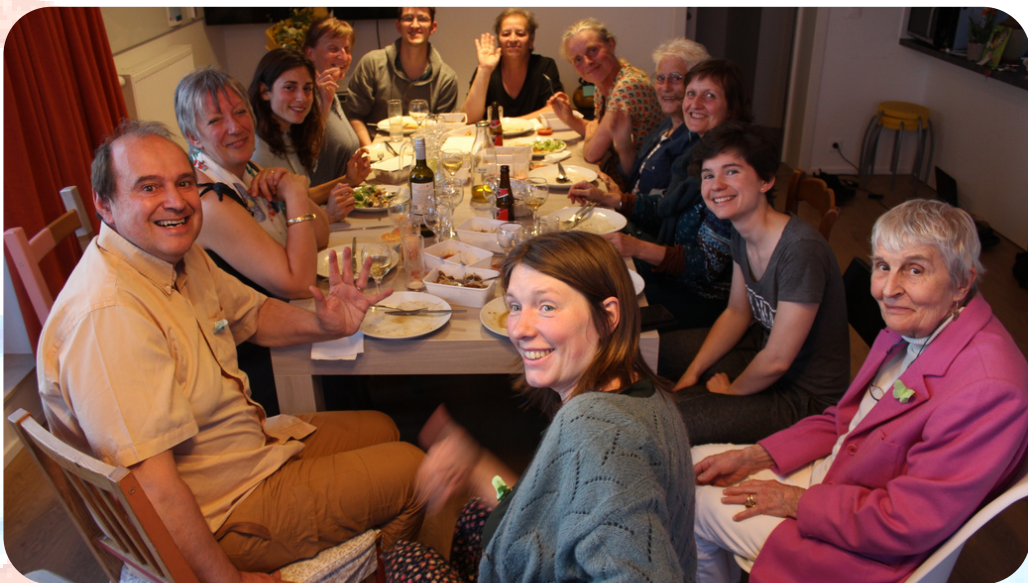
Souper - 2022

Leur implication dans le projet est importante : c'est une des clés de succès du projet, mais aussi un risque d'épuisement auquel le projet veut faire attention.