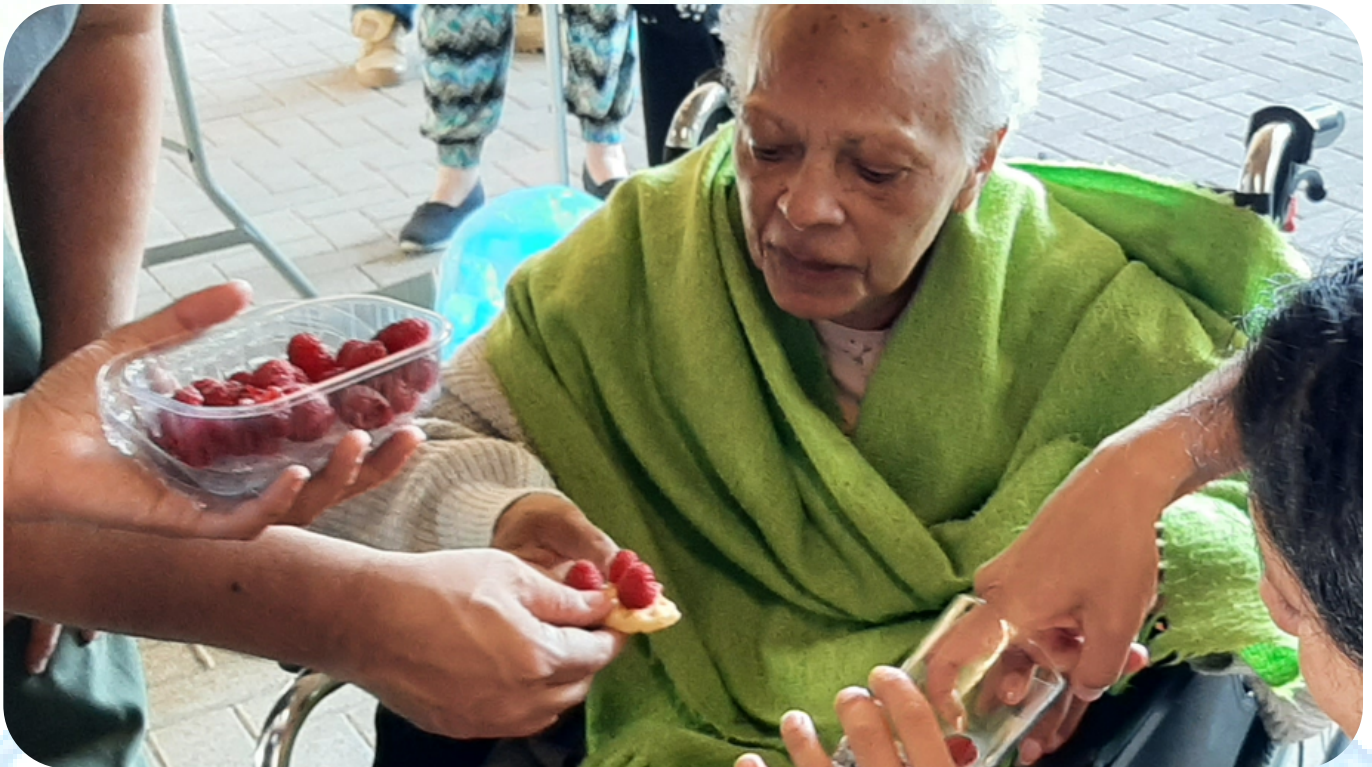
Visite du marché des habitants - 2022

En 2022, Pass-ages a accueilli deux hôtes. Ces premiers accueils ont démontré l'énorme plus-value humaine de Pass-ages. Ils ont été évalués via des entretiens avec les volontaires, les familles et les soignants, dans l'optique d'améliorer la qualité de l'accueil.