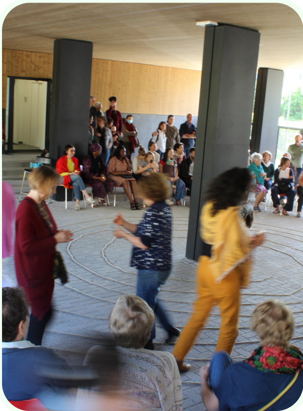
Inauguration de Pass-ages - 2022

Le moment fort de l'année 2022 est l'événement d'inauguration du projet le 8 mai. A cette occasion, deux journées de visites portes ouvertes ont été organisées, un moment d'inauguration officielle avec le Ministre de la santé bruxelloise, ainsi qu'une journée inaugurale avec le spectacle «Naître » de Vivre en fol compagnie et un rite inaugural du projet.