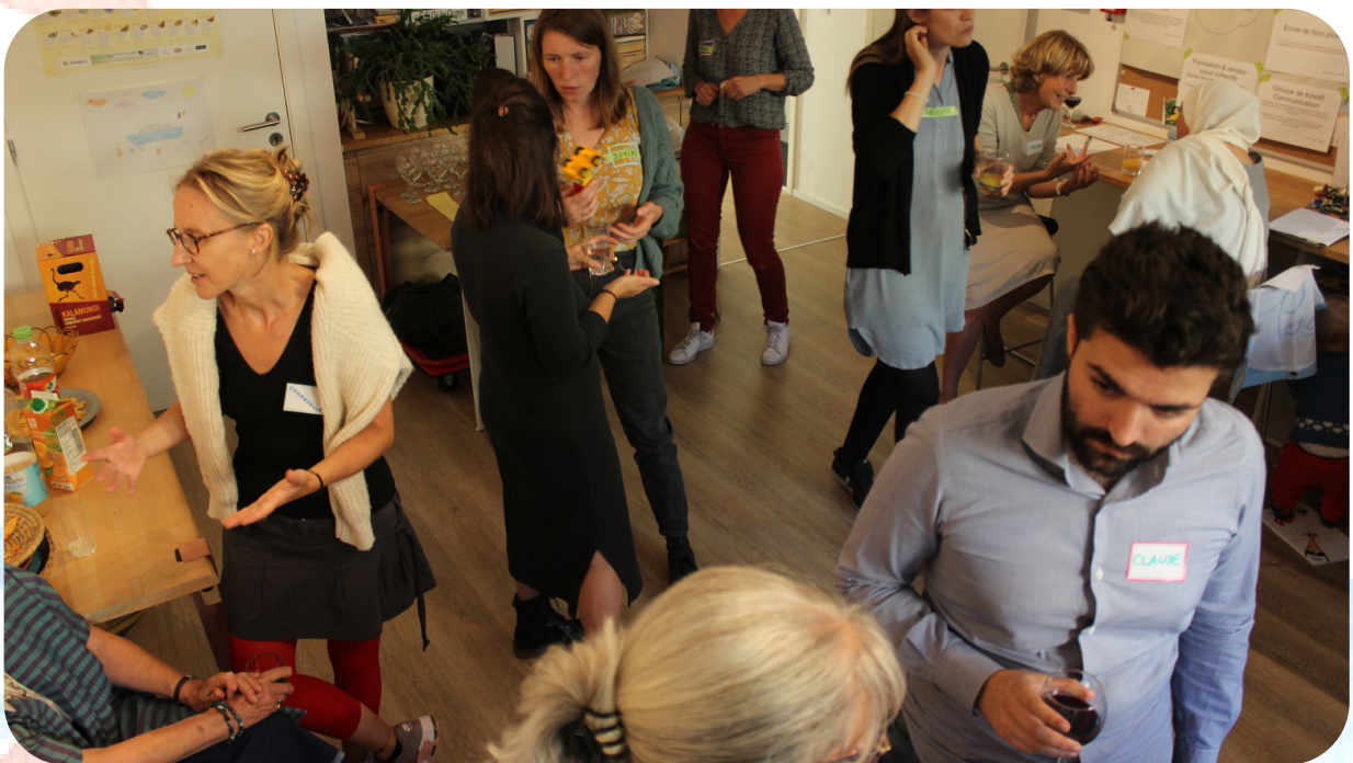
Fête des volontaires - 2022

C'est faire de Pass-ages un espace de vie qui accueille la naissance et la mourance en collaboration avec les professionnel.les de soin.