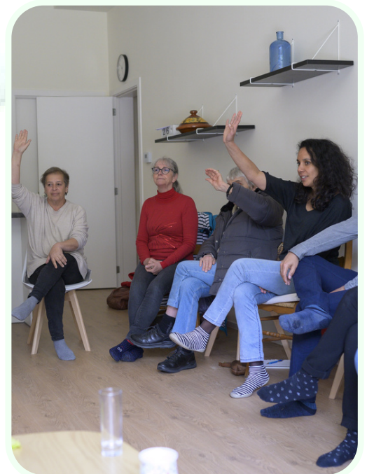
Formation à l'écoute - 2022

Inscrivez-vous à notre newsletter info@pass-ages.be