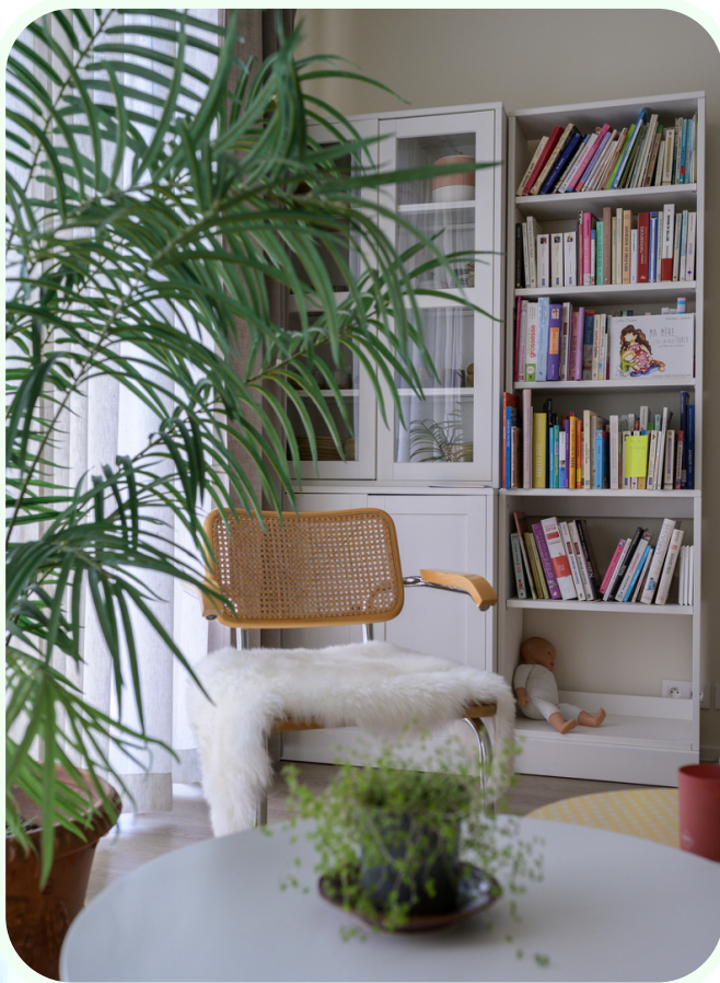
Maison de naissance - 2022

Un groupe de travail aménagement est mis en place fin 2021 avec pour mandat d'entretenir les espaces et améliorer l'aménagement.