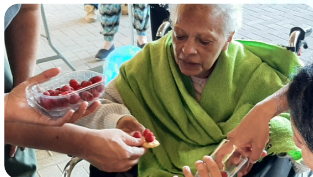
Hôte en mourance - 2022

La maison de mourance, ouverte à toutes et à tous, héberge et accompagne des personnes en soins palliatifs qui souhaitent vivre leur fin de vie dans un environnement chaleureux qui rappelle le domicile.