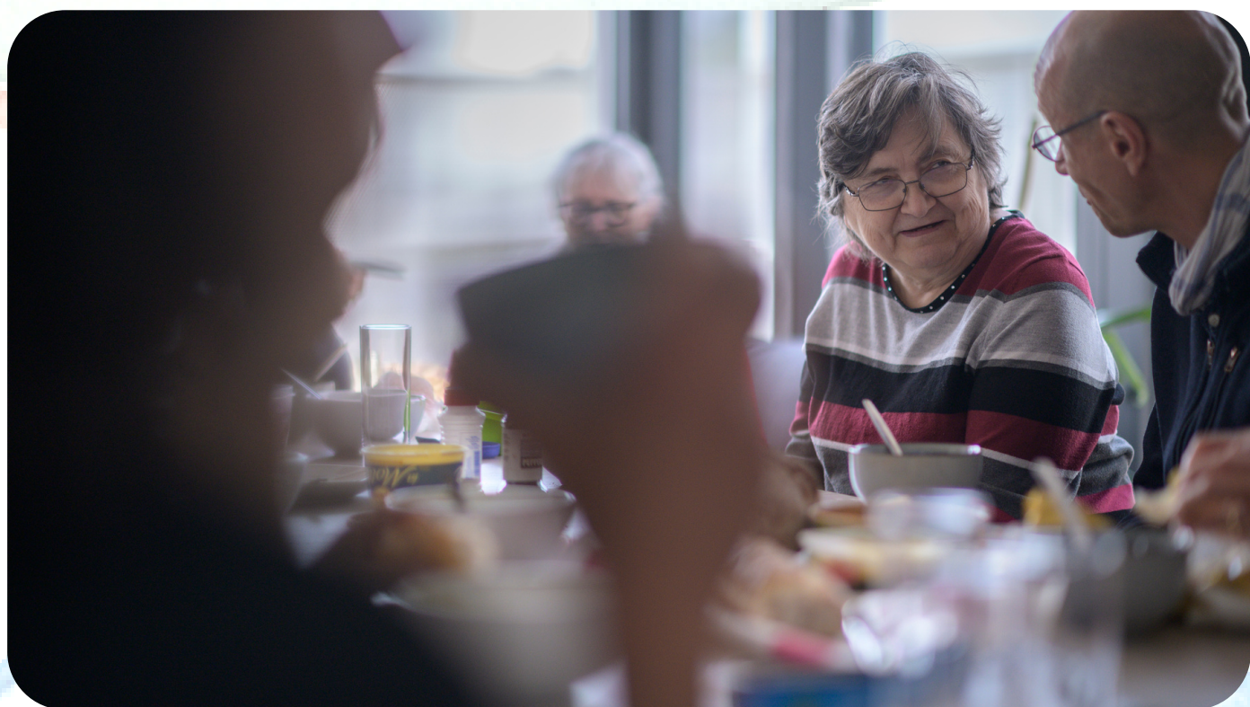
Formation à l'écoute - 2022